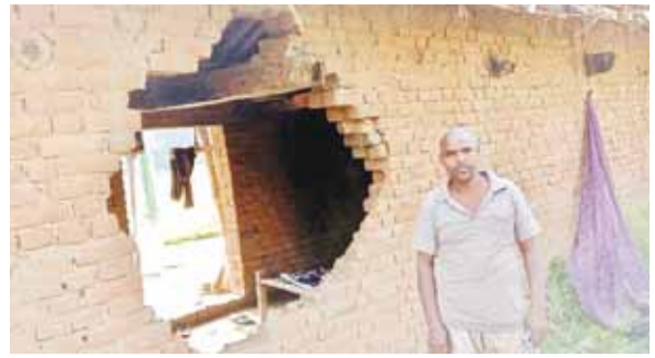
हरिभूमि न्यूज अनूपपुर।